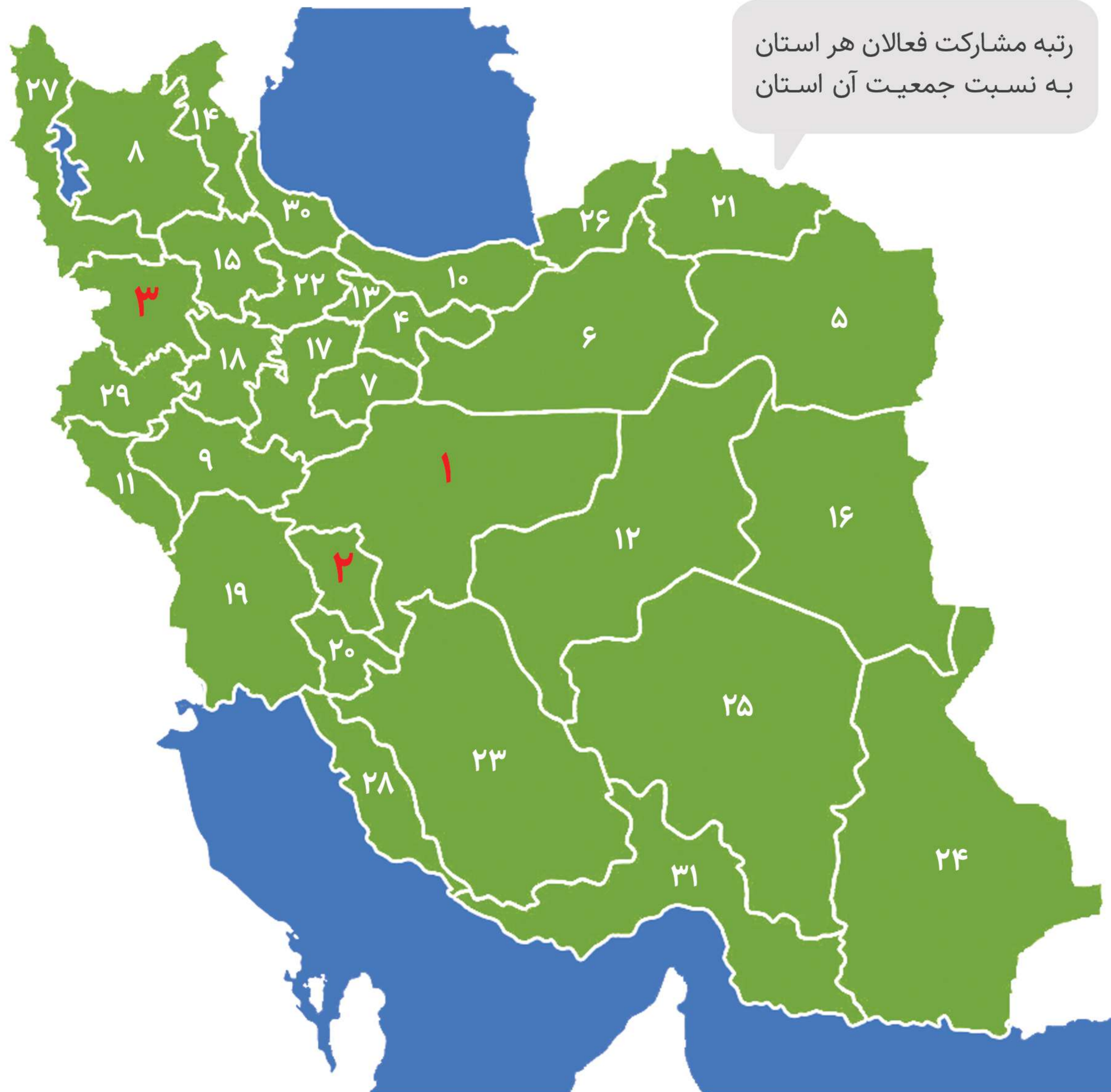
رتبه مشارکت استانی | درصد فراوانی | فراوانی پاسخ | استان